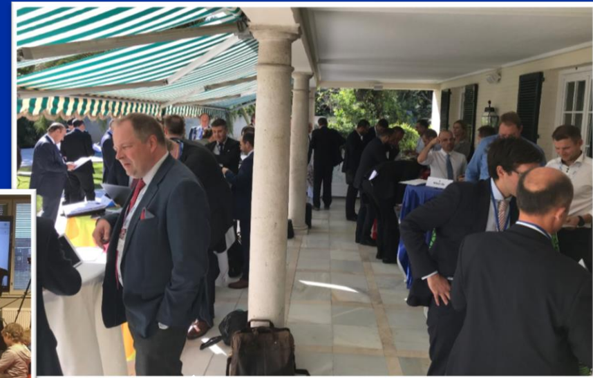
Team Finland -vierailu Portugalissa ja Espanjassa