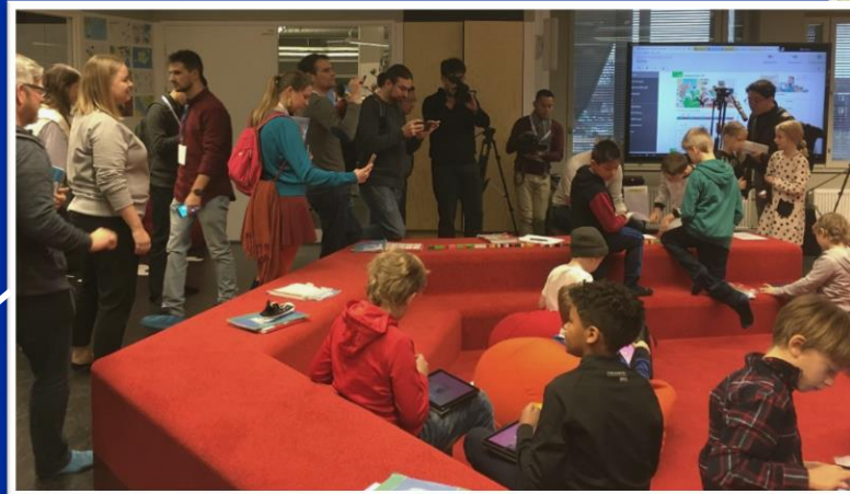
Kansainvälinen mediamatka, Kalasataman koulu, Helsinki