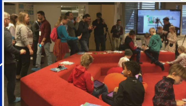
Kansainvälinen mediamatka, Kalasataman koulu, Helsinki