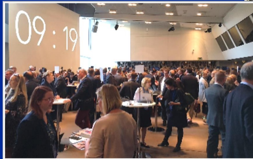
Speed dating Team Finland - päivässä