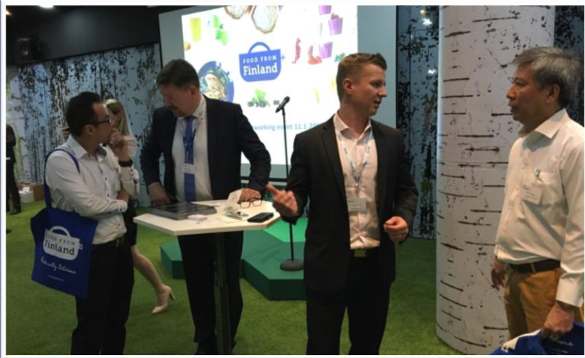
Networking Event, Singapore