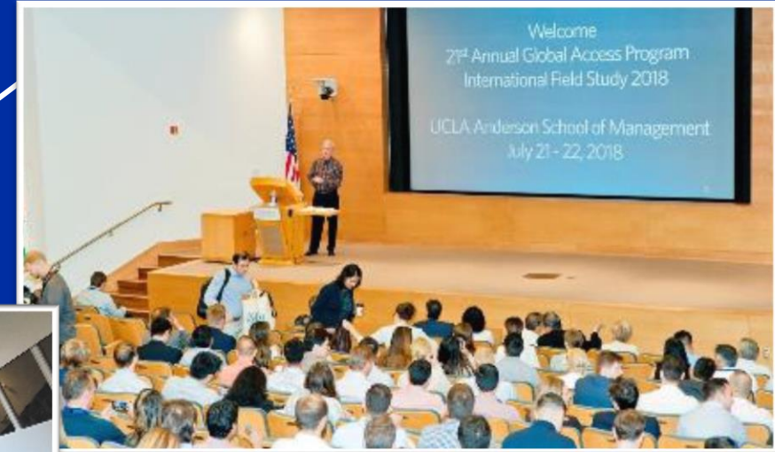
Global Access Program (GAP) Kaliforniassa