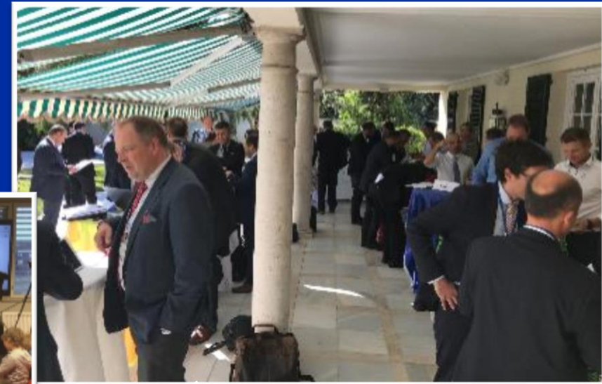
Team Finland -vierailu Portugalissa ja Espanjassa