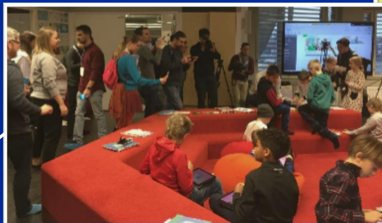
Kansainvälinen mediamatka, Kalasataman koulu, Helsinki