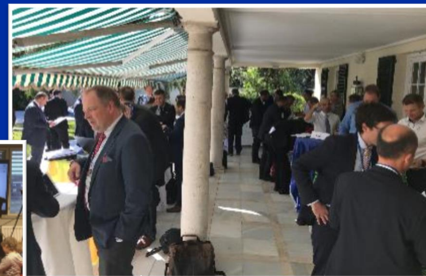
Team Finland -vierailu Portugalissa ja Espanjassa