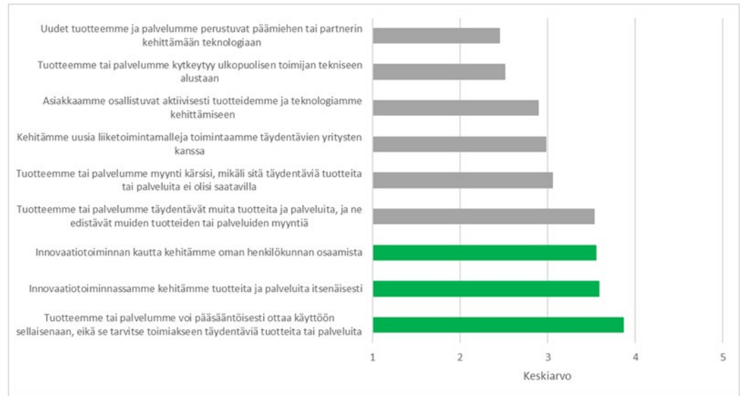
Kuva 3. Keskisuurten kasvuyritysten rooli innovaatiotoiminnassa. Yritysten (n=97) vastaukset 1= "ei lainkaan tärkeä" ja 5 = "erittäin tärkeä".

Vihreän siirtymän ja digitalisaation murrokset kasvattavat ekosysteemien merkitystä liiketoiminnan uudistamisessa