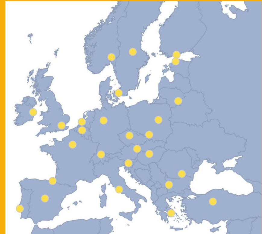
The European Network of National ITS Associations