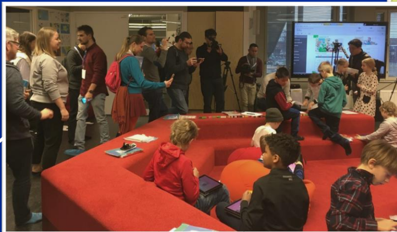
Kansainvälinen mediamatka, Kalasataman koulu, Helsinki