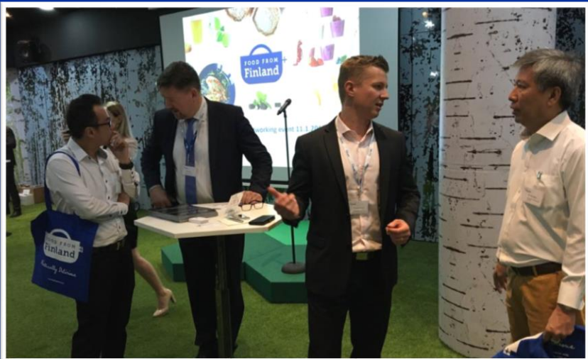
Networking Event, Singapore