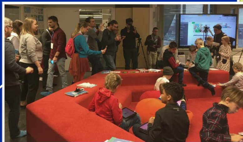
Kansainvälinen mediamatka, Kalasataman koulu, Helsinki