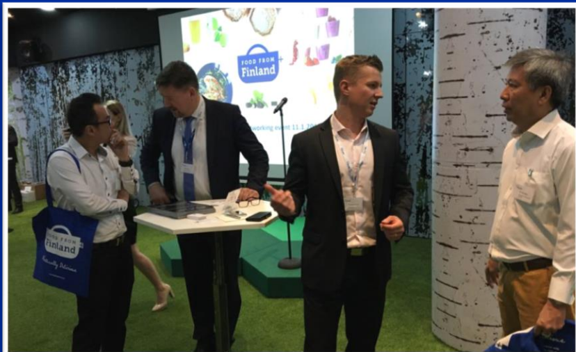
Networking Event, Singapore