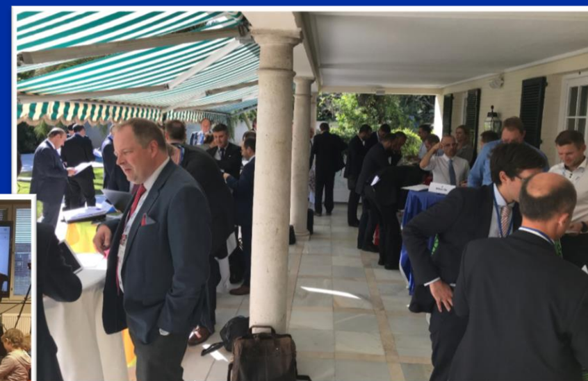
Team Finland -vierailu Portugalissa ja Espanjassa