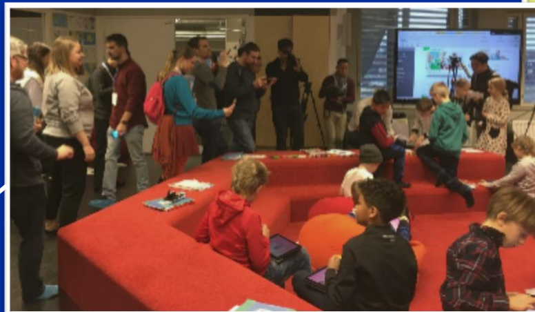
Kansainvälinen mediamatka, Kalasataman koulu, Helsinki