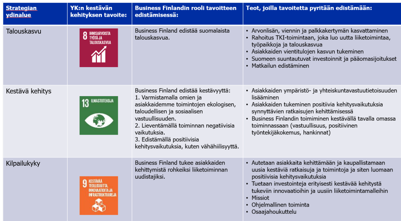
Taulukko 12: Business Finlandin strategian ydinalueet ja YK:n kestävän kehityksen tavoitteet. 12

Oheisessa taulukossa on kuvattu Business Finlandin strategian 2021–2025 ydinalueet, niiden mukaiset YK:n kestävän kehityksen tavoitteet sekä Business Finlandin rooli tavoitteen edistämiseksi ja teot, joilla se pyrkii edistämään tavoitetta. Tosin, tietyn tavoitteen edistämiseksi tehdyt toimet edistävät usein myös muita tavoitteita. Alla esitetyt ydinalueet muodostavat myös Business Finlandin yhteiskuntavastuun olennaiset teemat. Yhteiskuntavastuuraportoinnin olennaiset teemat on hyväksytty Business Finlandin johtoryhmässä, sillä teemat pohjautuvat Business Finlandin strategiaan, joka on johtokunnan hyväksymä.