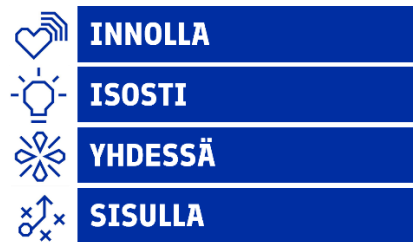
Kuva 2: Business Finlandin arvot.

Business Finlandin arvot näkyvät henkilöstön päivittäisessä työssä asiakkaiden, kumppanien ja kollegoiden kanssa. Ne luovat pohjan Business Finlandin toiminnalle ja auttavat Business Finlandia saavuttamaan strategiset tavoitteensa. Ne ovat Business Finlandin kulttuurin kulmakivet. Arvot on otettu osaksi rekrytointi- ja perehdytysprosessia sekä palkitsemista.