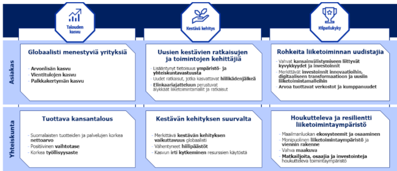
Kuva 3: Business Finlandin vaikuttavuustavoitteet.

Asiakastason tavoitteet perustuvat Business Finlandin asiakkailleen luomaan arvoon ja kertovat suuntaa antavasti Business Finlandin vaikutuksesta asiakkaidensa ja sitä kautta yhteiskunnan kehittymiseen. Business Finland arvioi onnistumistaan mittaamalla asiakkaidensa menestymistä. Tulossopimuksen tunnuslukutavoitteet asetetaan asiakkuustason tavoitteille. Yhteiskunnan tasolla olevat tavoitteet liittyvät läheisesti Business Finlandin ydintehtävään: siihen, että Business Finland luo vaurautta Suomelle. Business Finlandin vaikuttavuus yhteiskunnallisella tasolla ei ole suoraan mitattavissa, koska myös muut tekijät vaikuttavat näihin tavoitteisiin. Tämän vuoksi Business Finland arvioi menestystään näiden tavoitteiden osalta vaikuttavuusarvioinneilla.